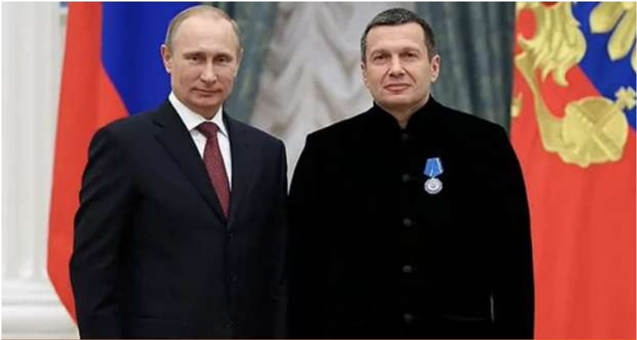
Vladimir Soloviev, a la derecha, junto al presidente ruso, Vladimir Putin.