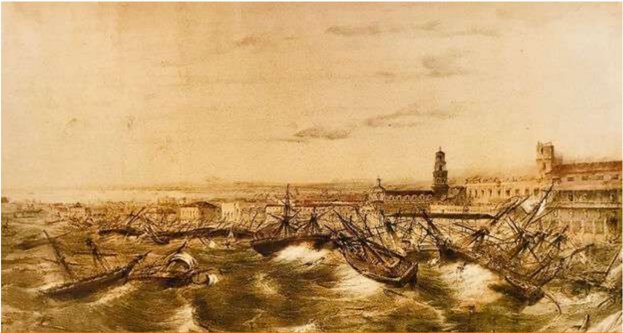
'Huracán de 1846', en el puerto de La Habana, litografía de Federico Mialhe. (Museo Nacional de Bellas Artes)