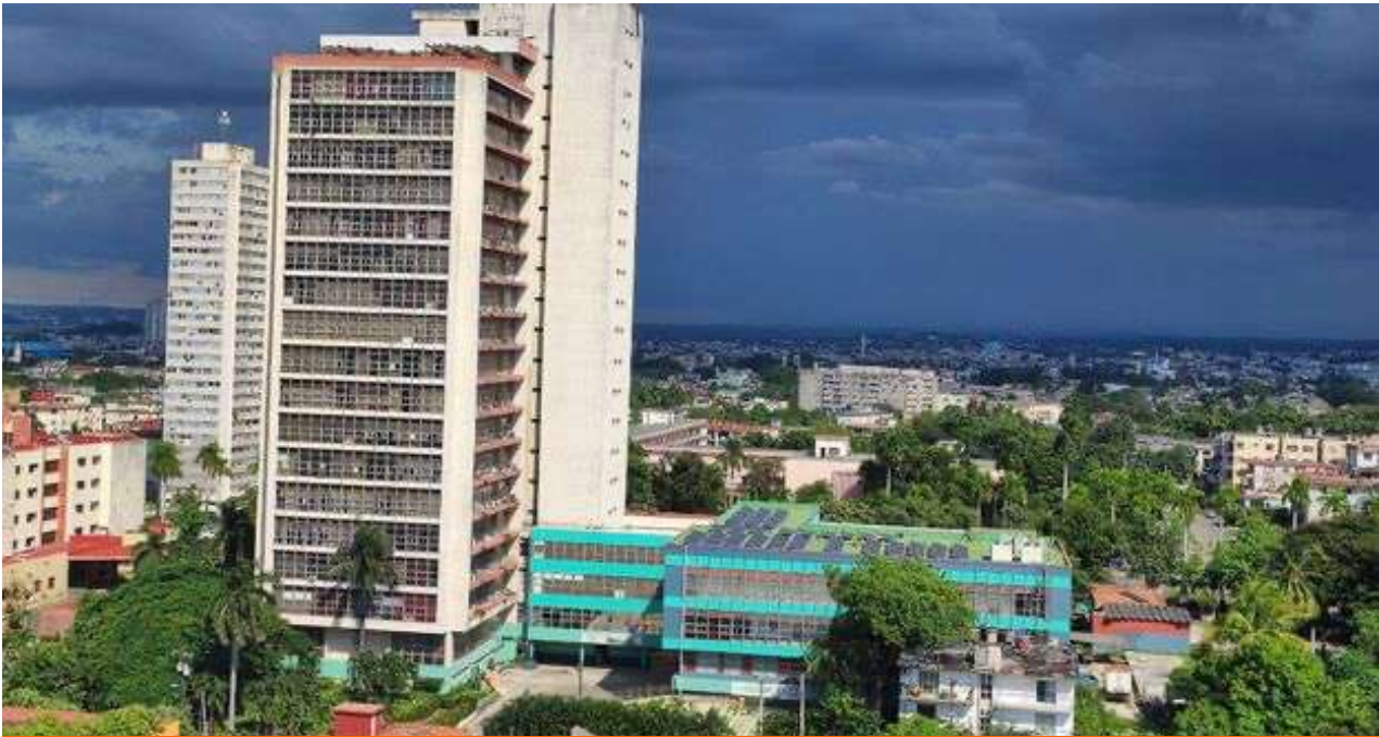
Ministerio de la Agricultura, ubicado en la esquina de Conill y Rancho Boyeros, en La Habana. (14ymedio)