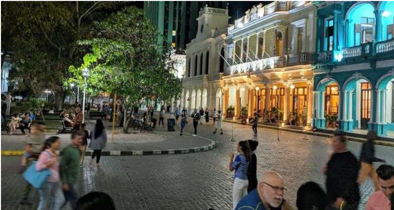
La Marquesina, en el costado izquierdo del teatro La Caridad, de Santa Clara, dejará de existir. (Vanguardia)