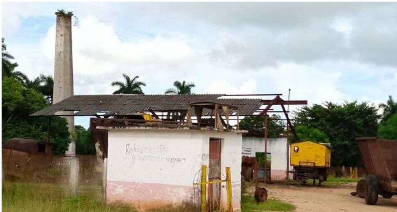
La cooperativa de La Julia, que ahora debe asumir toda la producción local para la zafra en Villa Clara, también está en plena decadencia.