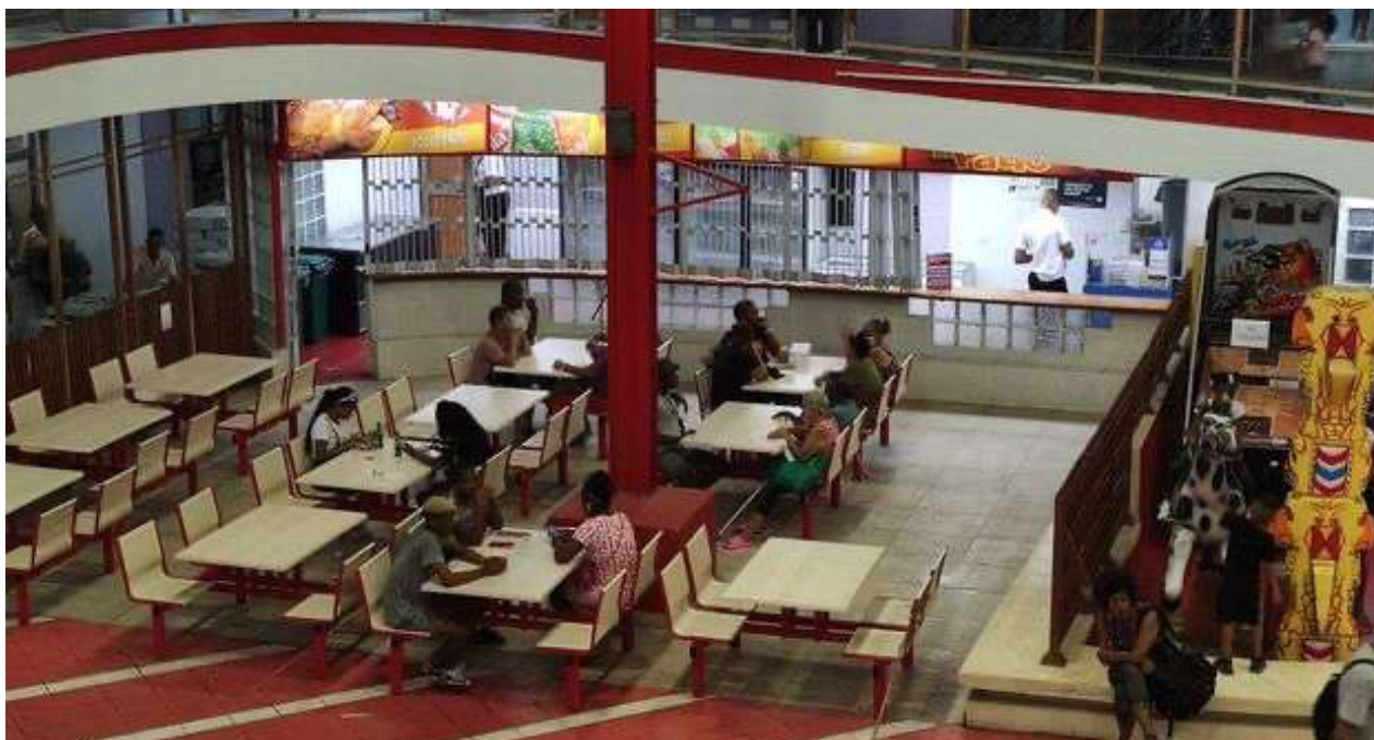
Los primeros cuarenta clientes de este miércoles, sentados comiendo su cuarto de pollo.