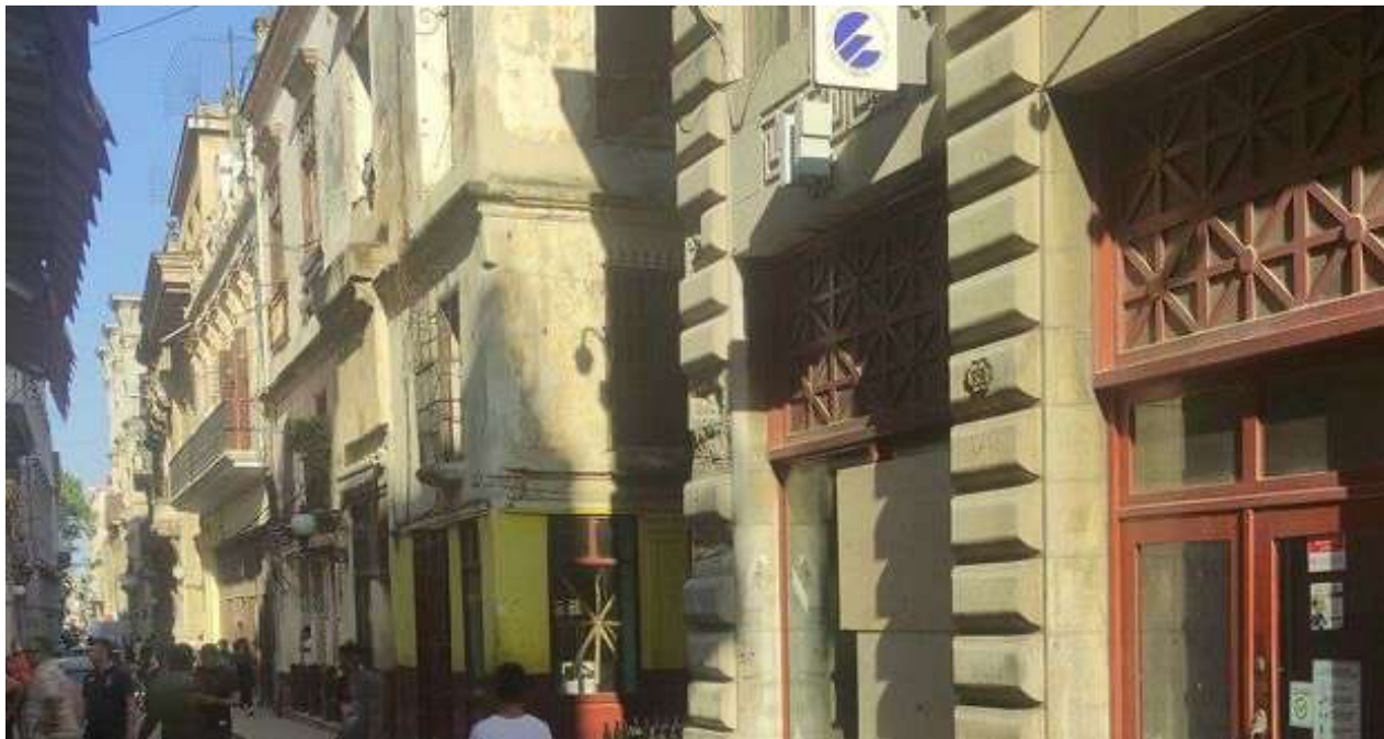
Oficina de Etecsa de la calle Obispo, en La Habana Vieja.