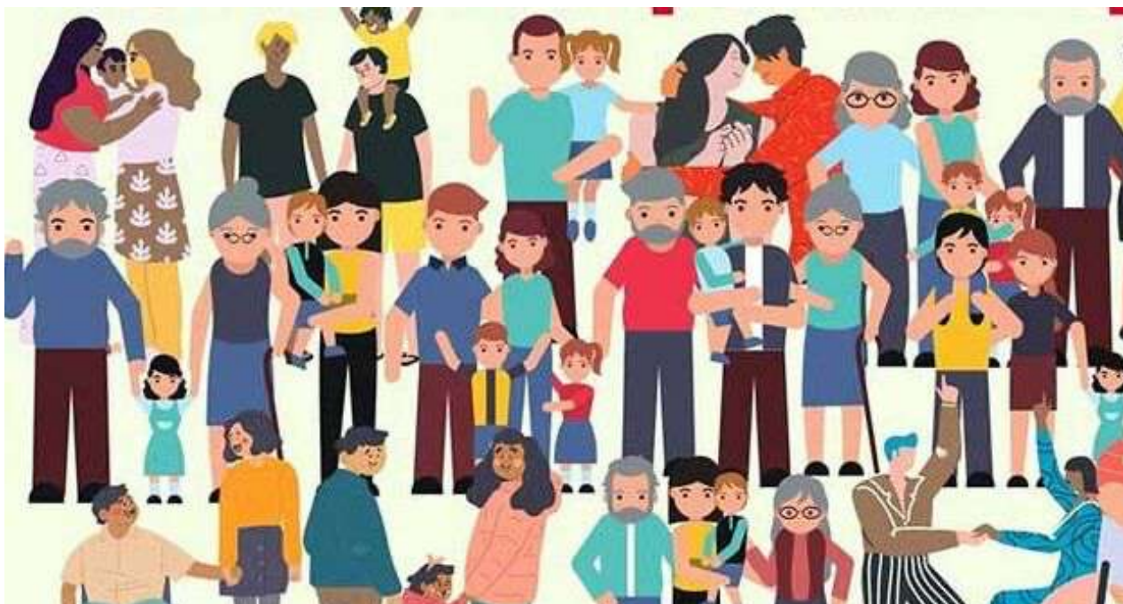
Cartel promocional oficialista del Código de las Familias.